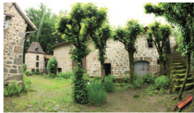
Pigeonnier, grange-étable et escalier menant à l'ancienne boulangerie